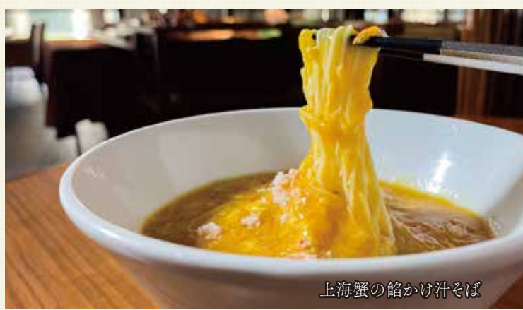
上海蟹の餡かけ汁そば

スペシャリティ 上海蟹の餡かけ汁そば ... ¥3,100 上海蟹とフカヒレの餡かけ汁そば ..... ¥3,600 極上フカヒレ餡かけ汁そば ..... ¥2,900