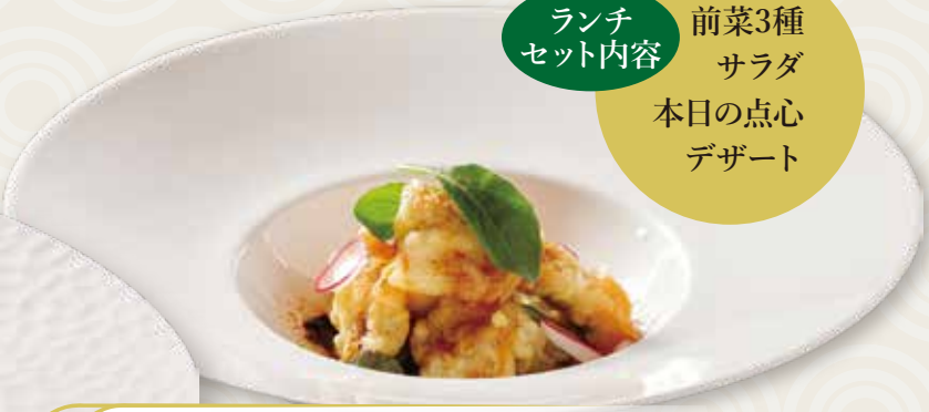
穴子のフリット 花椒香る香味ソース