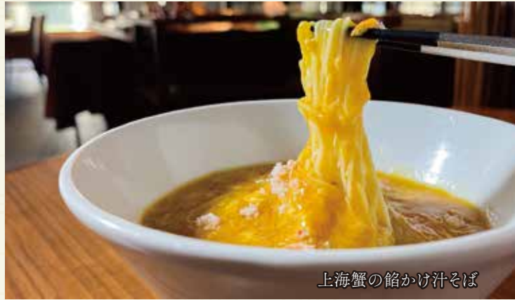
上海蟹の餡かけ汁そば