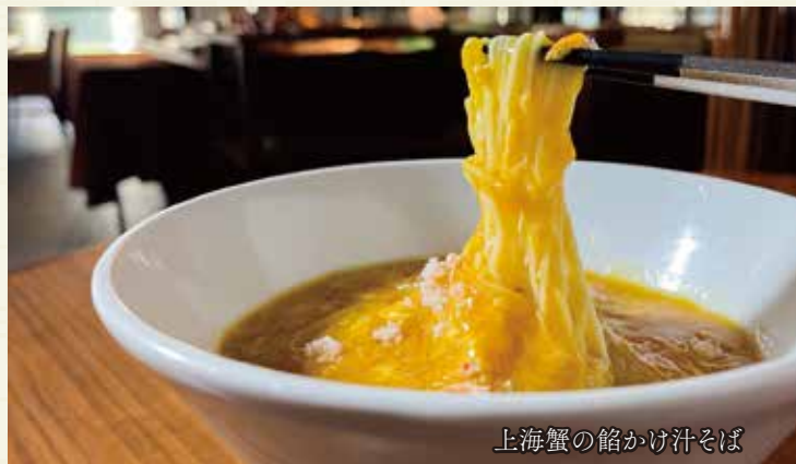
上海蟹の餡かけ汁そば