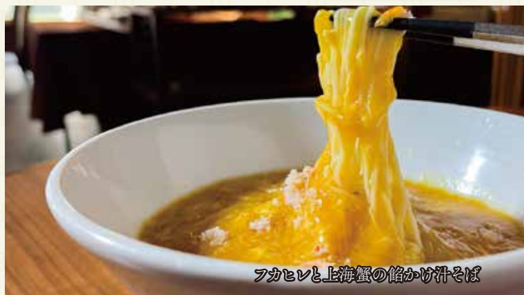
フカヒレと上海蟹の餡かけ汁そば

極上フカヒレ餡かけ汁そば ..... セット ¥2,700 土日祝価格 ¥2,900