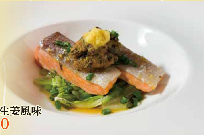
秋鮭蒸しの葱生姜風味 ¥1,400