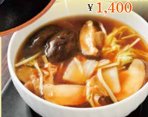
しいたけ餡かけ麺 ¥1,400